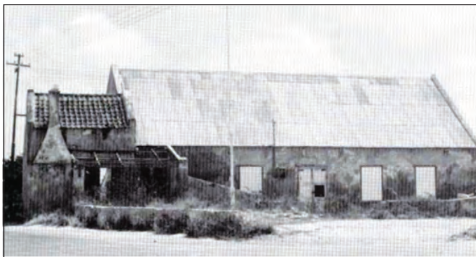
Esaki ta e edifisio, aktual SKAL, den kua e hòspital di katibu tabata ubiká.